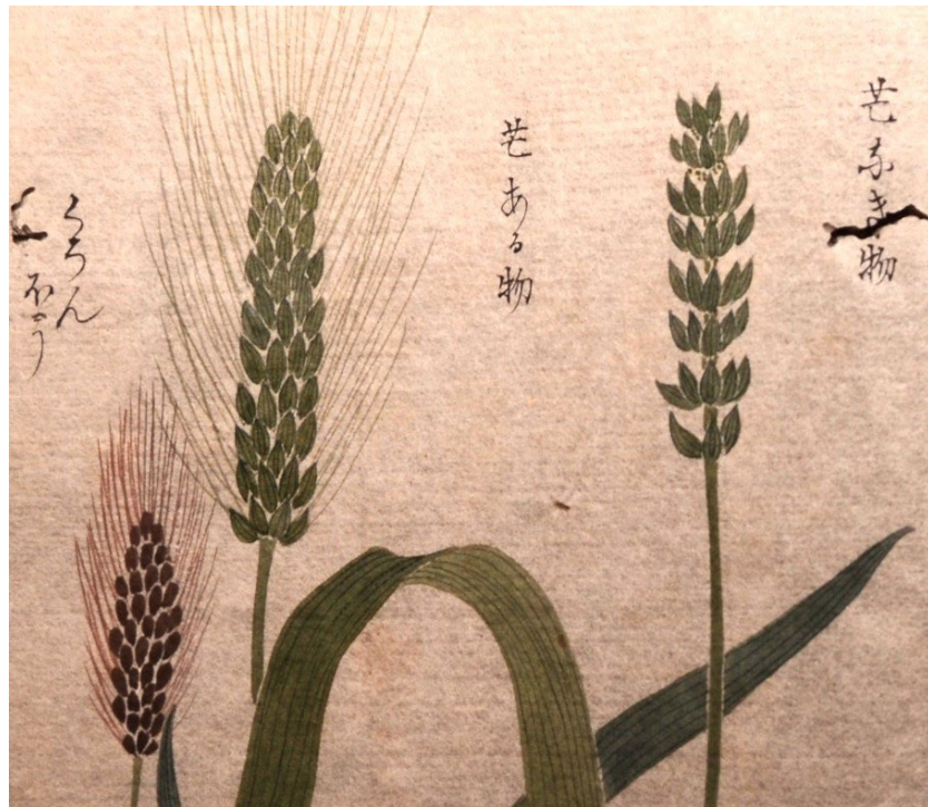
昔の稲（本草図譜より）